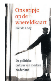
Piet de Rooy: Ons stipje op de wereldkaart . De politieke cultuur van modern Nederland. We-reldbibliotheek, 414 blz. € 29,95